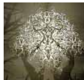
Forms in Nature. Daarboven: Halo.

mel. Tactisch geplaatste gaatjes projecteren een constellatie naar keuze.