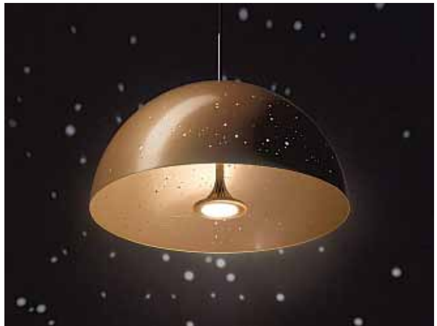
De Starry Light Lamps zijn leverbaar met verschillende stukken sterrenhemel.

Deze lichtbronnen zijn wel heel ver verwijderd van een simpel peertje