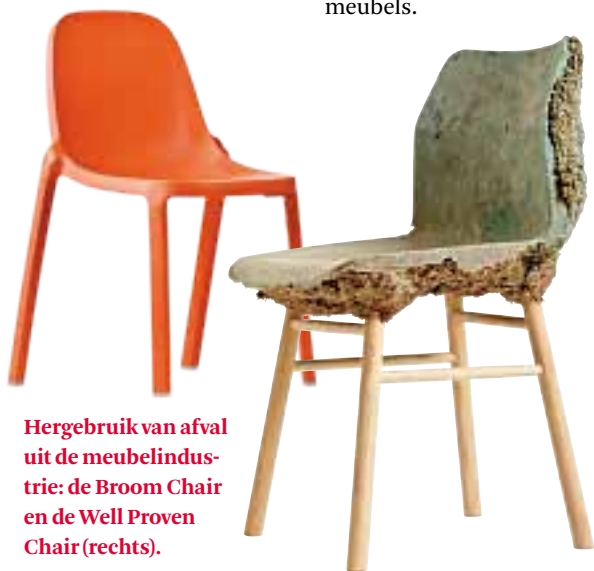
Hergebruik van afval uit de meubelindustrie: de Broom Chair en de Well Proven Chair (rechts).

Het besef dat de meubelindustrie zelf actie moet ondernemen op het gebied van duurzaamheid, dringt ook bij de grote merken door. Zo lanceerde Ikea recent een inzamelings-service voor oude matrassen. De materialen worden hergebruikt voor nieuwe meubels.